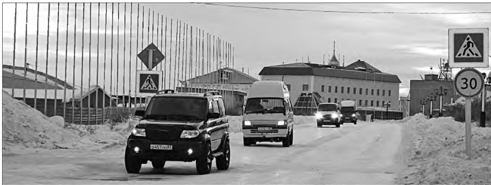
↑ С каждым годом на дорогах Эгвекинота появляется все больше автомобилей.

Штраф за управление транспортом в нетрезвом виде является серьезным административным взысканием, при котором предусматривается наказание не только в качестве изъятия прав, но и в выплате большой суммы. Теперь водитель, который попался в пьяном виде впер-