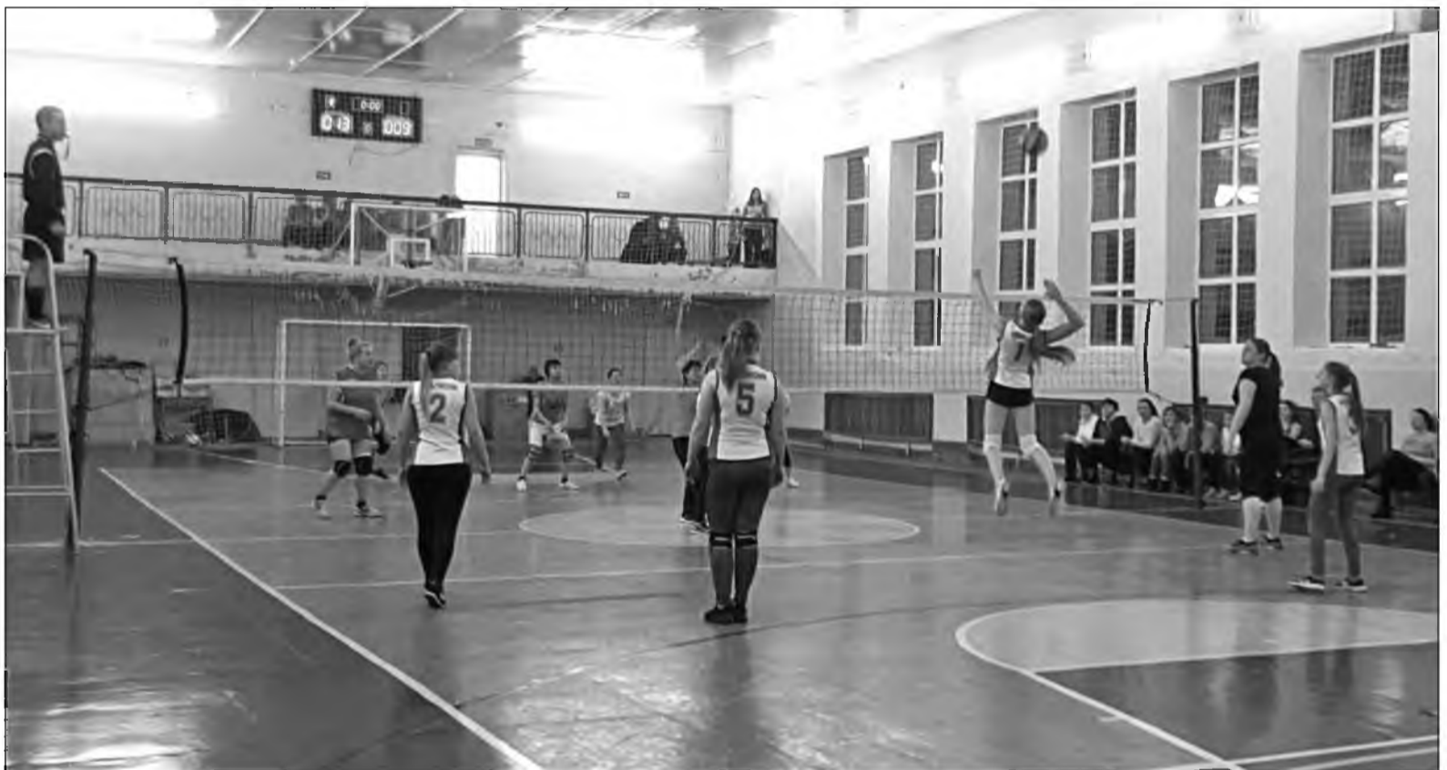
↑ Соревнования по волейболу между женскими командами.